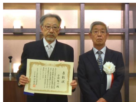
安保 様 平沼本部長