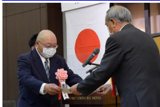
岡本本部長より授与されました