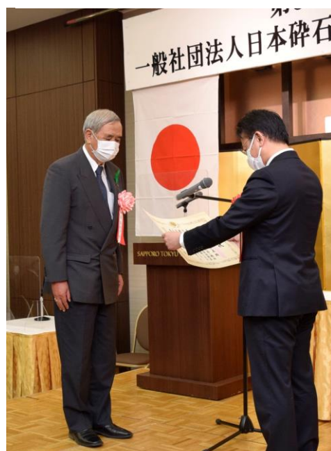
池山局長より授与されました